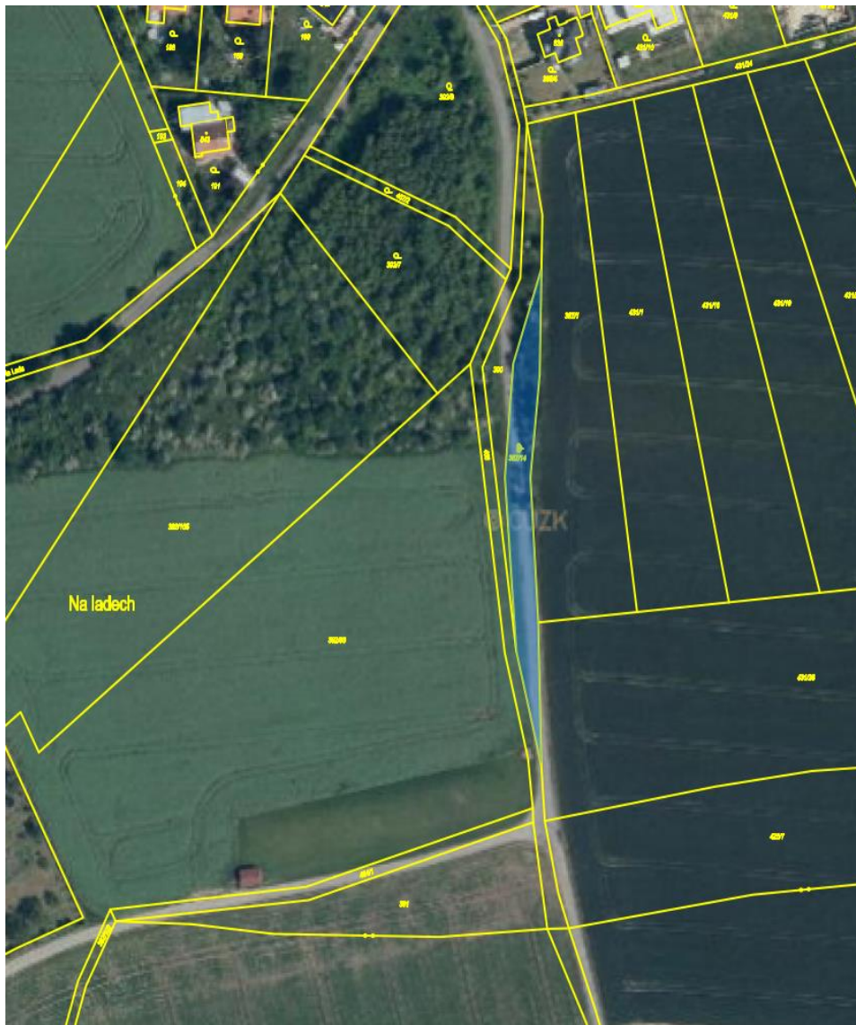
Pozemek parc. č. 387/14 v k.ú. Zdiby

Pozemek parc. č. 387/14 v k.ú. Zdiby a pozemek parc. č. 121 v k.ú. Brnky se nacházejí pod místní komunikací Chaberská nebo tvoří tzv. pomocný silniční pozemek podél této místní komunikace, která je dle § 9 odst. 1 zák. č. 13/1997 Sb. o pozemních komunikacích, ve znění pozdějších předpisů, ve vlastnictví obce Zdiby.