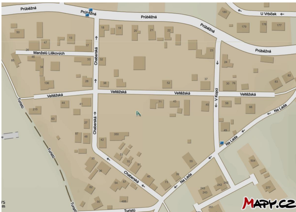
Lokalita č. 5: