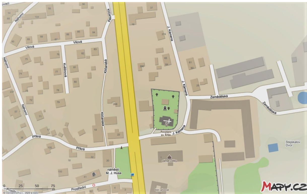
Lokalita č. 2: