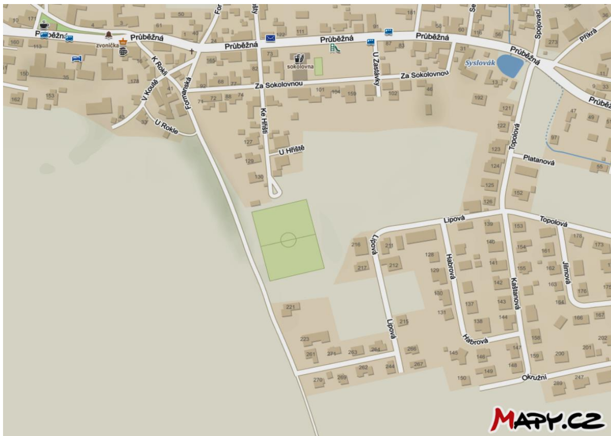
Lokalita č. 4: