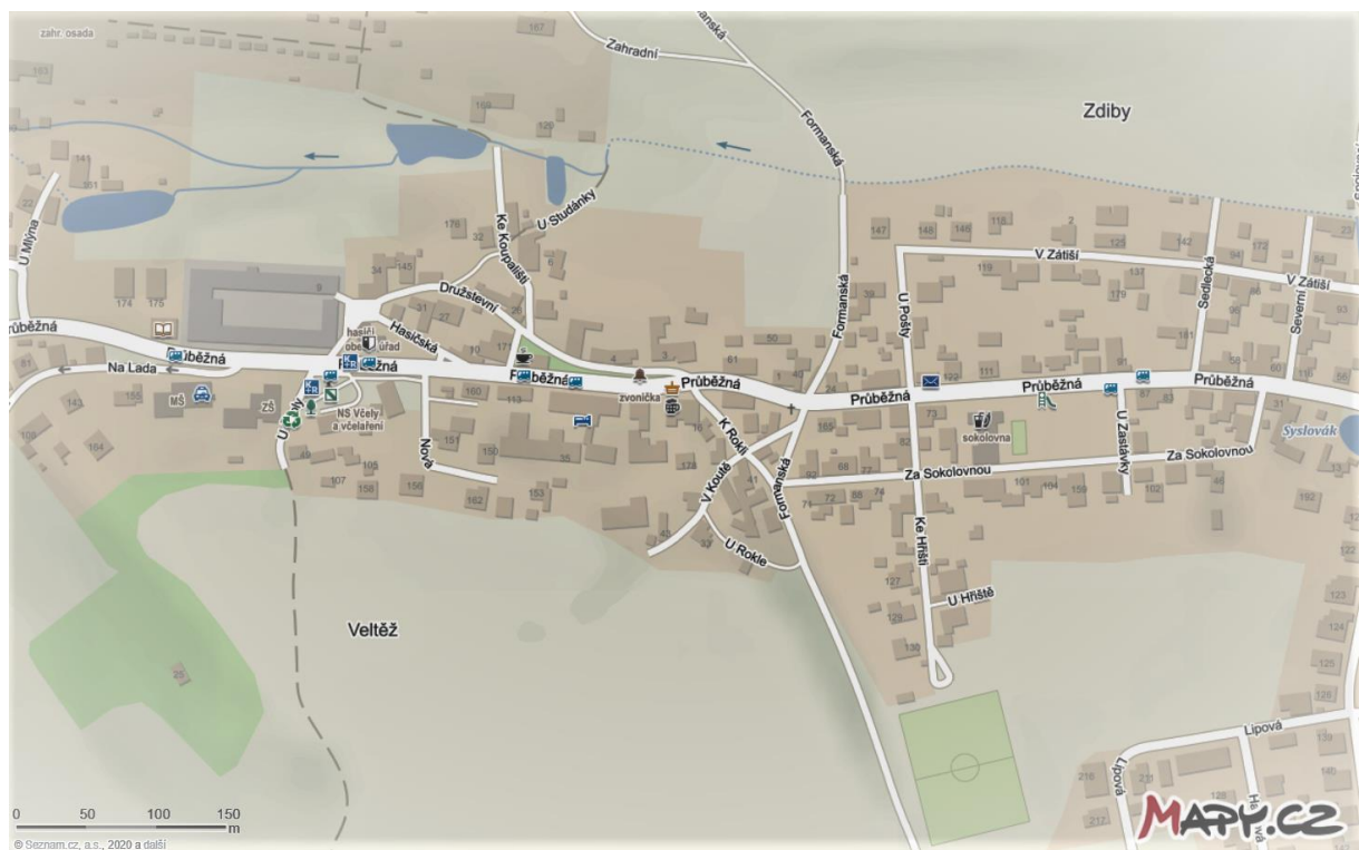
Lokalita č. 3: