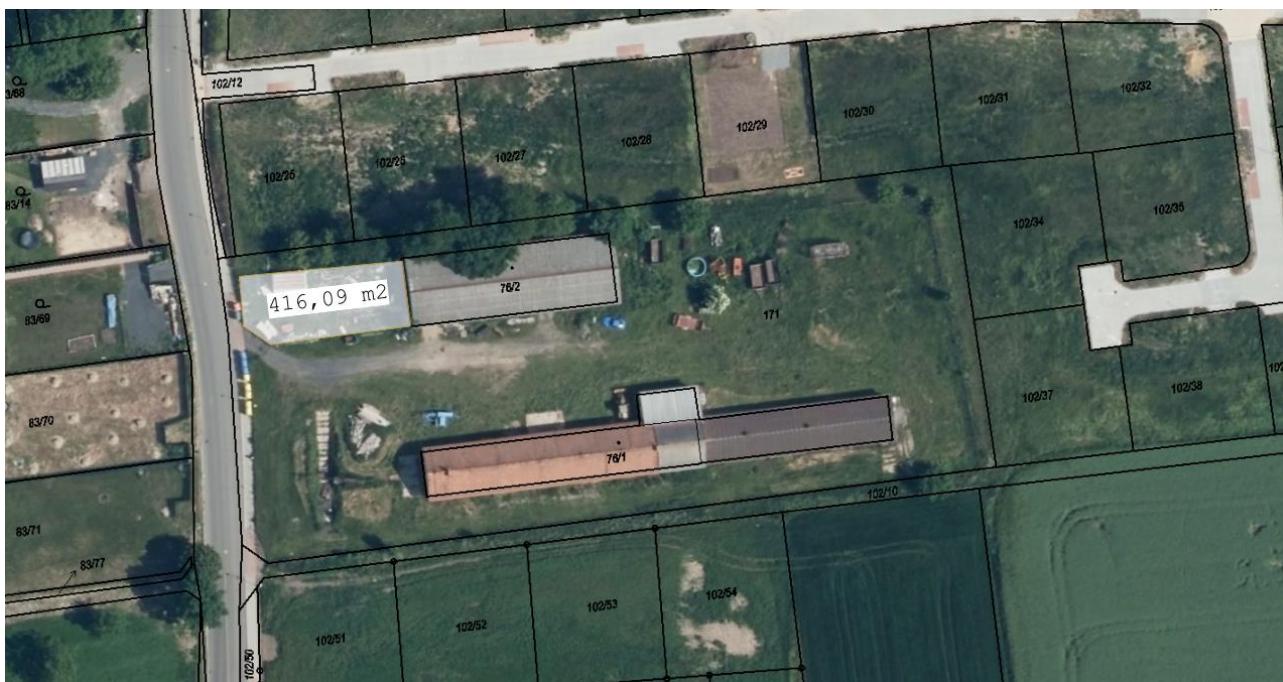
Obrázek č. 2 – plocha užívaná obcí – po zaokr. 416 m 2 .

Doba nájmu je 1 rok s možností automatické prolongace, max. na dobu 8 let za současného práva pronajímatel navyšovat nájem v závislosti na míře inflace.