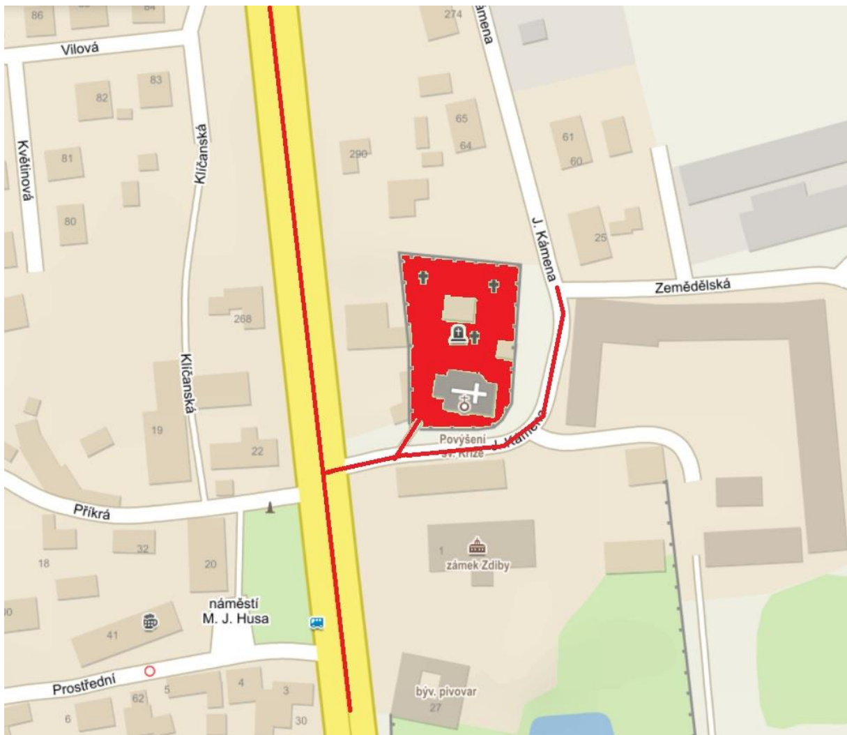
Lokalita č. 1:

a to vše v rozsahu či v hranicích vyplývajících z níže uvedeného mapového vyobrazení: